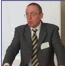
Coordinateurs des directions de recherches